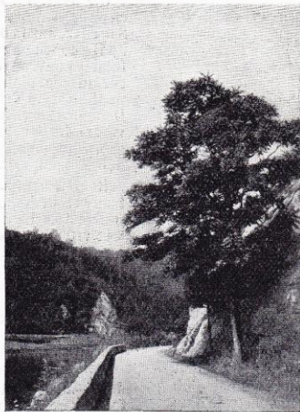
Route de Liège à Tilff.

Peu après, le hameau de Méry, aux ruelles